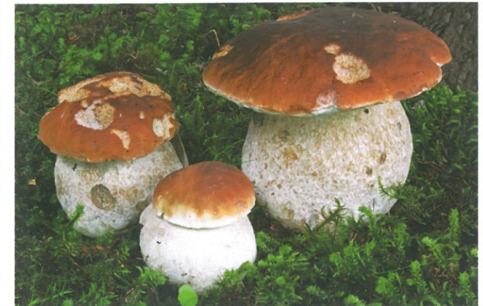
dal calendario di Gruppo 2013 (23ª edizione) Boletus edulis – commestibile

COMUNE DI VENEZIA AMICI DI VILLA TONIOLO RIVIERA XX SETTEMBRE, 22 - Mestre